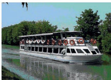
Tipologia di motonave