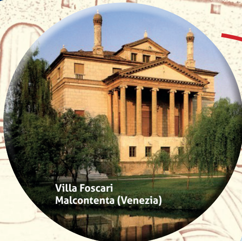
Villa Foscari Malcontenta (Venezia)