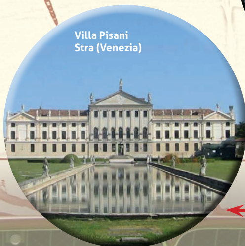
Villa Pisani Stra (Venezia)