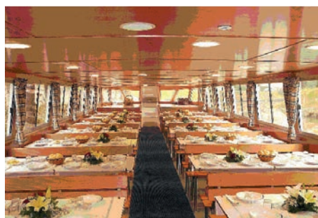
veduta tipo di interno salone