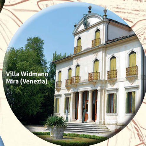
Villa Widmann Mira (Venezia)